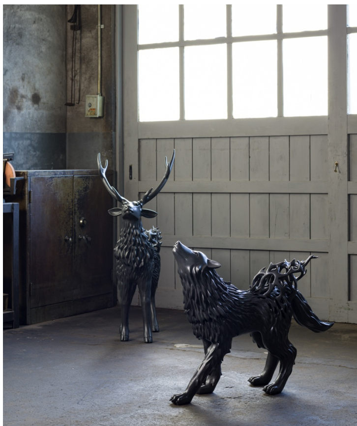
秋永 邦洋 / Kunihiro Akinaga 左「朧気(鹿)」2022, 陶 H100 × W20 × D80 cm 右「朧気(狼)」2022 陶, H63 × W24 × D80 cm