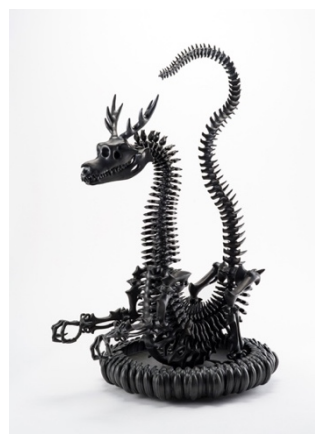
秋永邦洋「擬態化（龍）」2021 陶、H85 × W43 × D58 cm