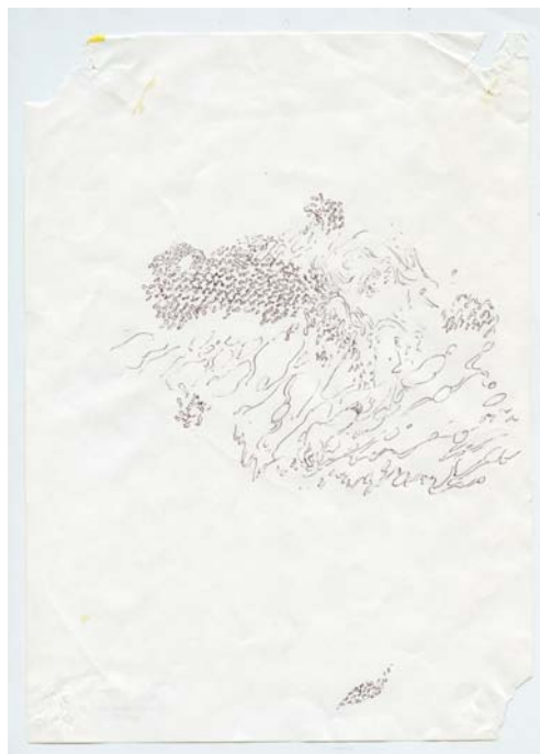
戯れ 2005 紙にインク、25.6×18.2cm