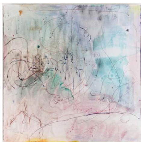
不詳 2017 板に墨、水彩、アクリル、インク、油彩、18.0×18.0×cm