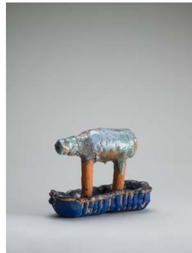
ボトルメールシップ 2021 陶、20.5×26×12 cm