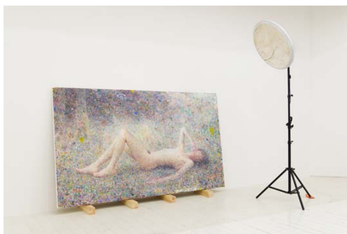
フロリアル - 汚い光に混じった大きな花粉 - 2012-2014 パネルに油彩、ミクストメディア、111.7×191.2cm 愛知県美術館所蔵