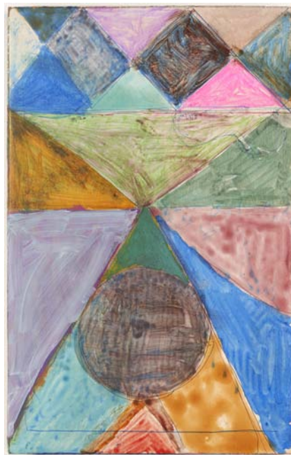
不詳(小さな王国) 2018 板に水彩、アクリル、油彩、インク、22.1×14.1cm 個人蔵