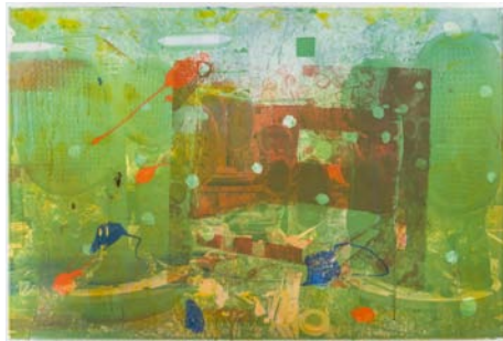
内なるスタジオ 2021 陶板、60×90 cm

また梅津は口バート・ラウシェンバーグが1982年に信楽に長期滞在し大塚オーミ陶業株式会社との協働で大型の陶板作品を制作していることに注目し、ラウシェンバーグの「コンパイン・ペインティング」や信楽滞在での経験を起点に32枚の陶板作品を大塚オーミ陶業で制作した。ちなみに支持体には建材用の陶板が使用された。本展においてこの陶板作品は陶芸と絵画、そして産業と芸術とを結びつける重要な役割を担うだろう。