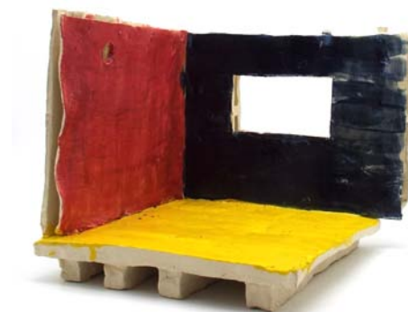
密室 2019-2020 陶、17.0×19.7×10.5cm 個人蔵

展示予定作品数： 絵画作品 約100点 / 陶芸作品 約200点 / 映像作品 3点